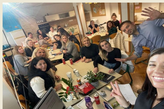
Testiranje portfelja orodij, Maribor, Slovenija