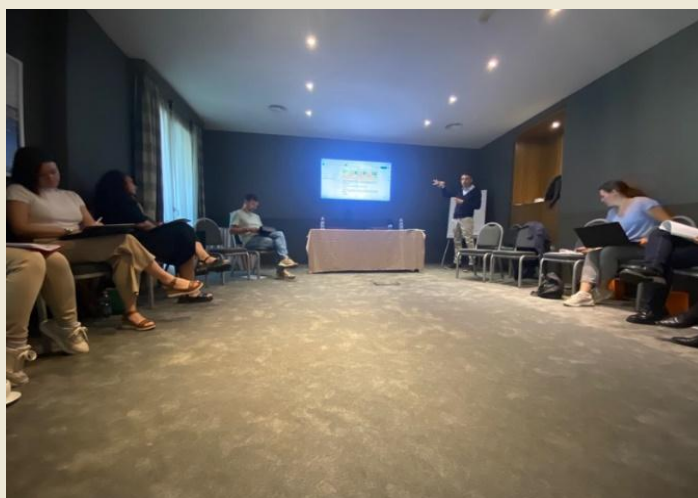
Srečanje partnerjev v Rimu